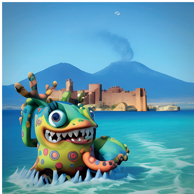
Sirena Partenope Altroviana